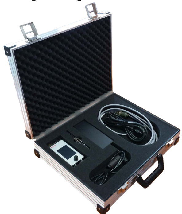
Servicekoffer VT-HDTSY-1-2X (R996043985)